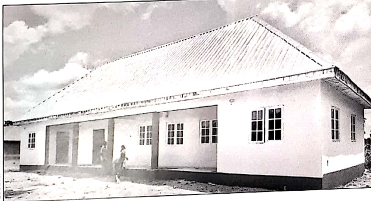
Vue extérieure du nouveau centre informatique en phase finition avant d'abriter les ordinateurs prévus pour la formation des jeunes.